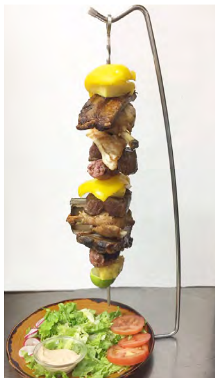
SPIEDONE CRAZY DRIVER