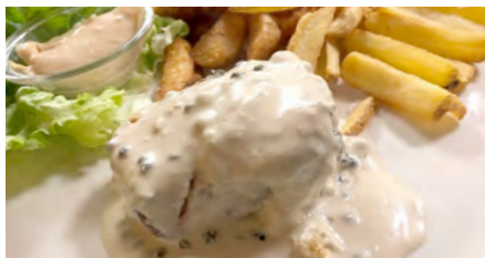
FILETTO HARD ROCK

Filetto di manzo da 250 gr al pepe verde servito con un contorno a scelta e salsa Crazy Driver®.